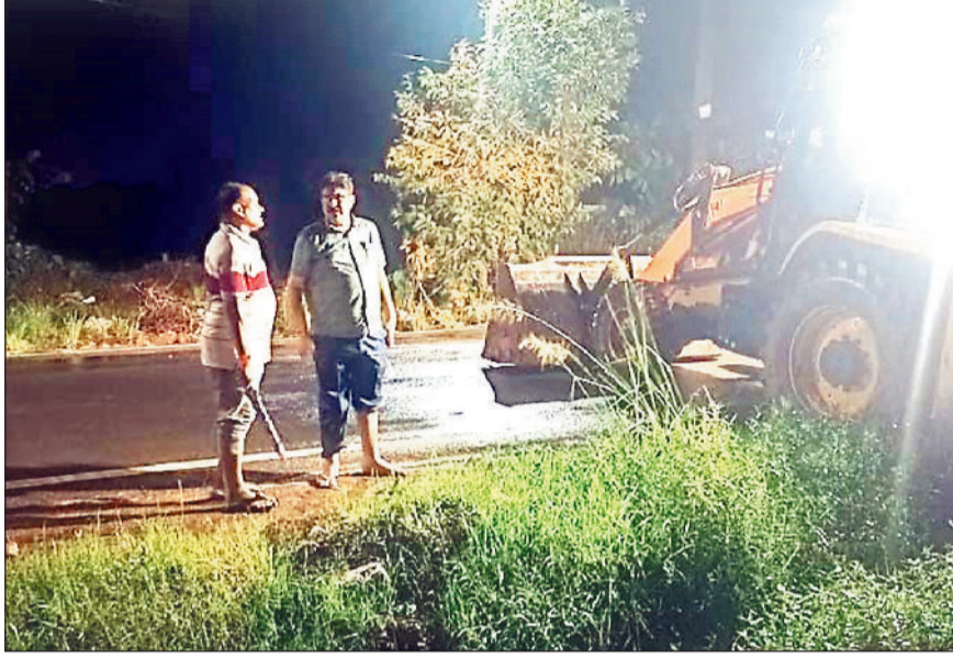
मौके पर पहुंच कर जेसीबी से निकासी कराते हुए।

जानकारी के अनुसार वाई क्रमांक 4, 7 और 15 के कई घरों में बारिश का पानी भर गया। घरों के भीतर फर्नीचर और जरूरी सामान तक पानी में भीग गए। नागरिकों का कहना है कि नालियों की सफाई समय पर नहीं होने और निकासी मार्ग बाधित होने से हर साल बरसात में यही स्थिति बनती है। एक महिला